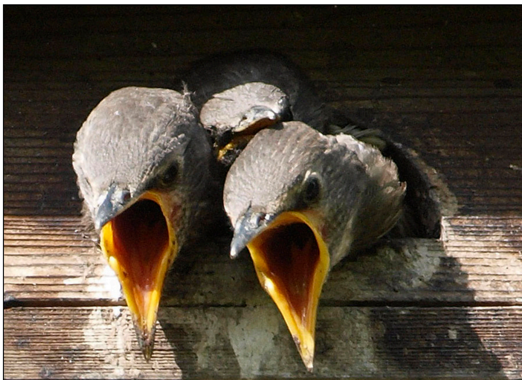
Bedelende jonge spreeuwen in een van de gierzwaluwkasten

December 2011 Tieneke de Groot Simón Bolívarstraat 89 3573 ZK Utrecht info@bureaufacet.nl